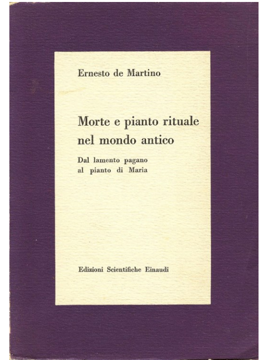
De Martino, Morte e pianto rituale nel mondo antico. Dal lamento pagano al pianto di Maria , Einaudi, Torino, 1958.