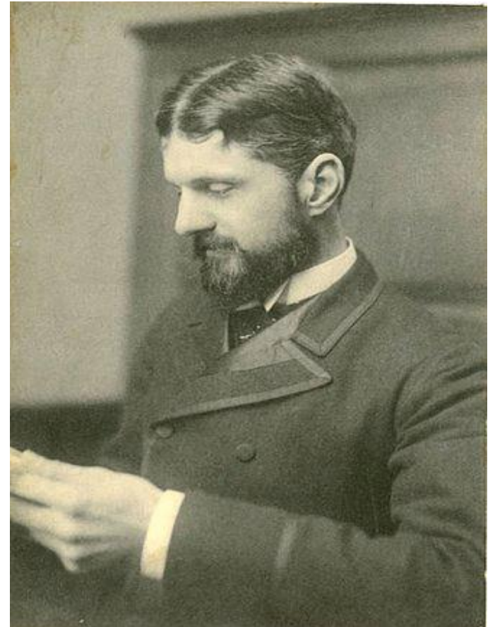
Benjamin Ives Gilman Boston Museum of Fine Arts