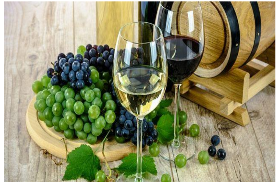
Produttori di vino