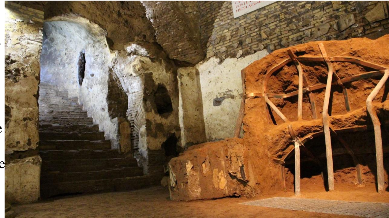
Roma, Catacombe dei SS. Marcellino e Pietro

Il mercato delle reliquie medievali era un fenomeno complesso e diffuso, intrecciato con le pratiche religiose e le dinamiche economiche dell'epoca. Le reliquie non erano solo oggetti di fede ma anche strumenti di potere e ricchezza per le chiese e le città che le possedevano.