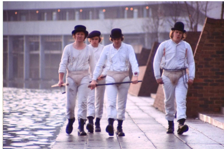
ARANCIA MECCANICA (A CLOCKWORK ORANGE, 1971) REGIA: STANLEY KUBRICK SCENEGGIATURA: STANLEY KUBRICK