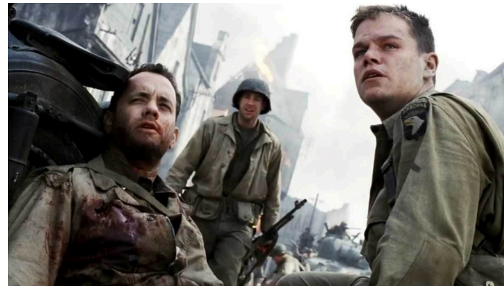
SALVATE IL SOLDATO RYAN ( SAVING PRIVATE RYAN , 1998) REGIA: STEVEN SPIELBERG SCENEGGIATURA: ROBERT RODAT

UNA STORIA COSTRUITA A PARTIRE DA UN QUADRO