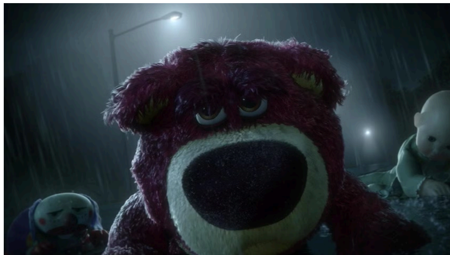
TOY STORY 3 (2010) - IL PASSATO DI LOTSO IL FLASHBACK MOSTRA LE ORIGINI DELLA MALVAGITÀ, PERMETTENDOCI DI EMPATIZZARE CON IL VILLAIN