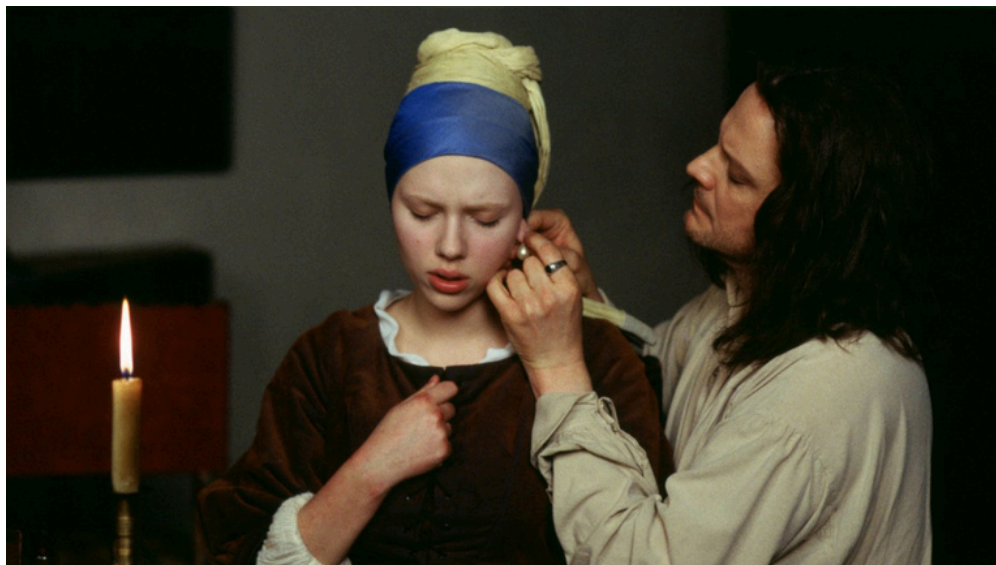
LA RAGAZZA CON L'ORECCHINO DI PERLA ( GIRL WITH A PEARL EARRING , 1998) REGIA: JOHN MADDEN SCENEGGIATURA: MARC NORMAN, TOM STOPPARD

Una sceneggiatura deve possedere un'idea centrale chiara e definita , e lo spunto giusto può attenderci ovunque.