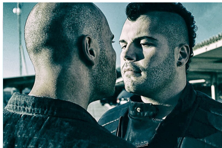
GOMORRA - LA SERIE (2014-2021) REGIA: AA.VV. SCENEGGIATURA: AA.VV.