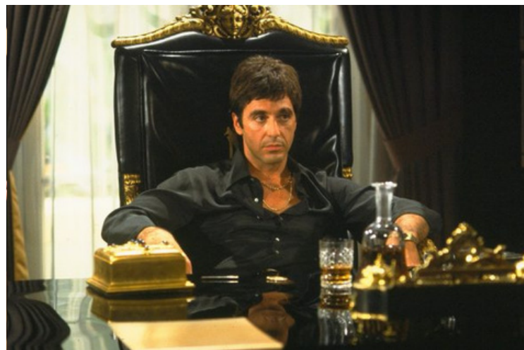
SCARFACE (1983) REGIA: BRIAN DE PALMA SCENEGGIATURA: OLIVER STONE