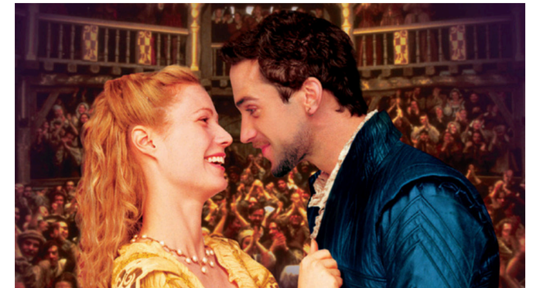
SHAKESPEARE IN LOVE (1998) REGIA: JOHN MADDEN SCENEGGIATURA: MARC NORMAN, TOM STOPPARD

UNA STORIA COSTRUITA A PARTIRE DA VICENDE REALMENTE ACCADUTE