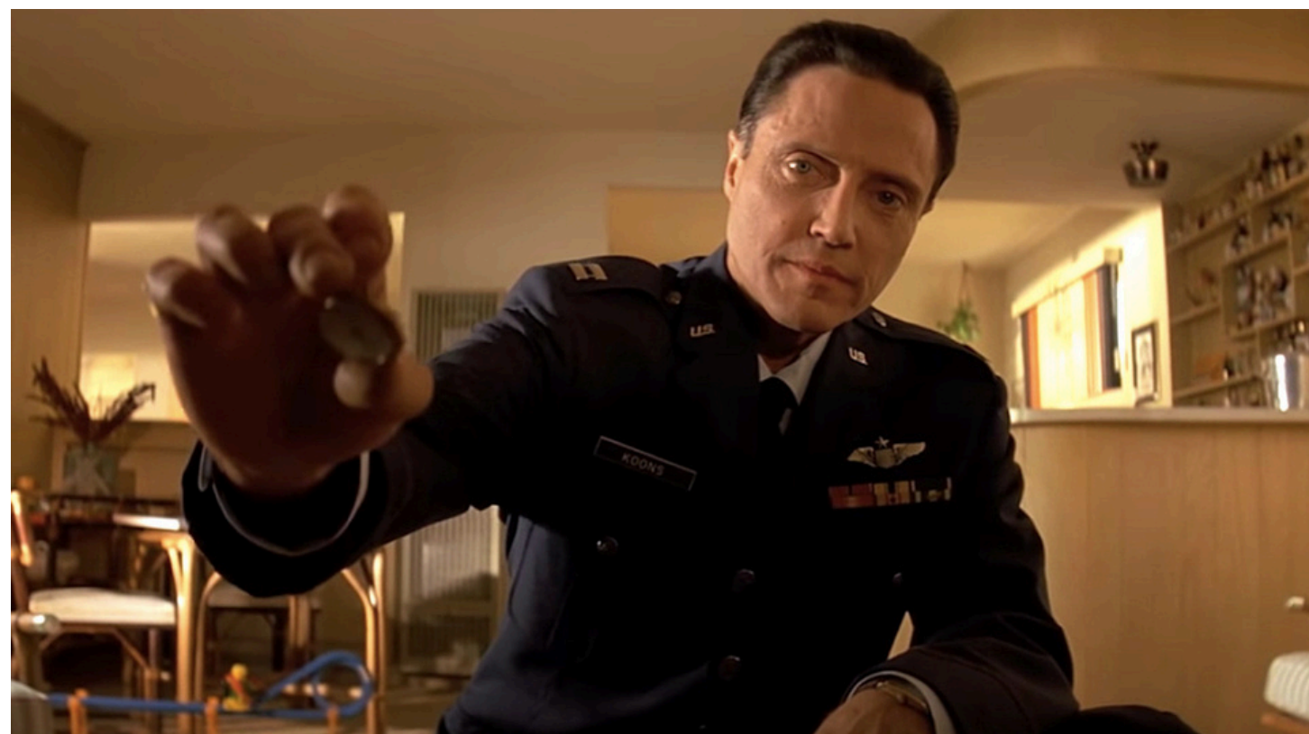
PULP FICTION (1994) - IL PASSATO DI BUTCH UN TIPICO ESEMPIO DI FLASHBACK