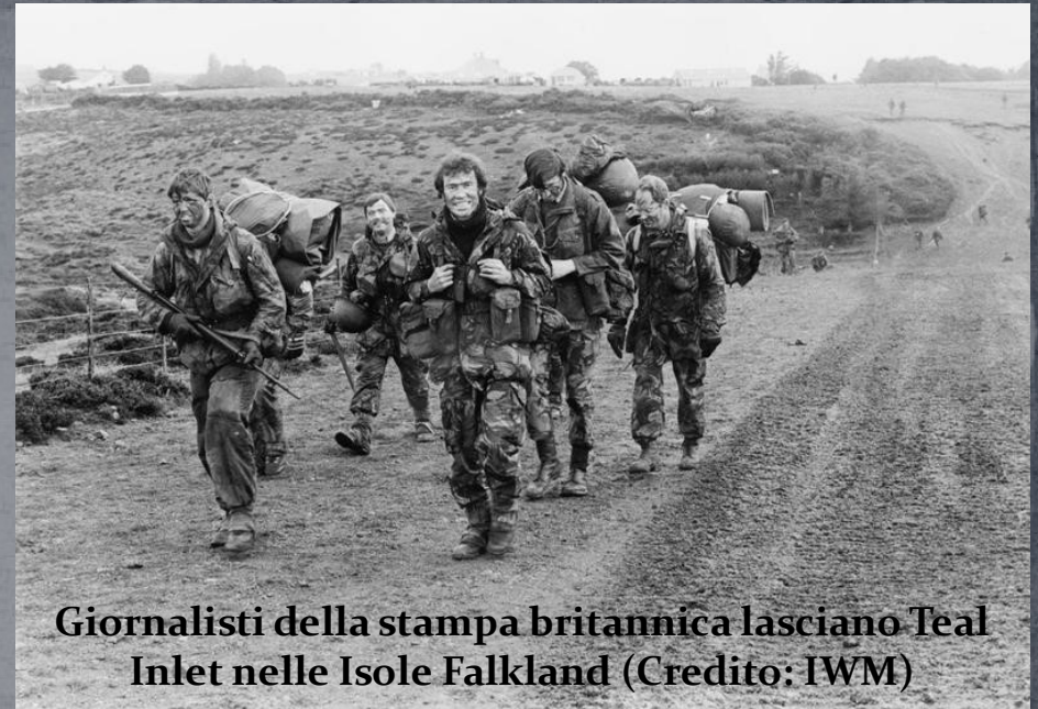
Giornalisti della stampa britannica lasciano Teal Inlet nelle Isole Falkland