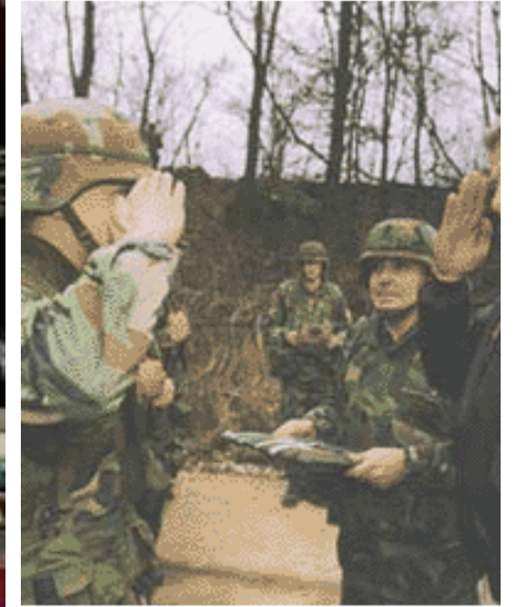
President Bill Clinton visiting U.S. Troop in Tuzla, Bosnia-Herzegovina