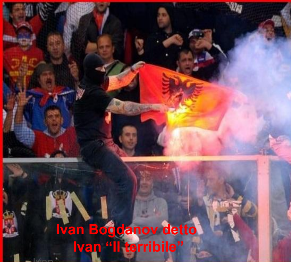
Ivan Bogdanov detto Ivan "Il terribile"

* https://www.startmag.it/mondo/russia-serbia/