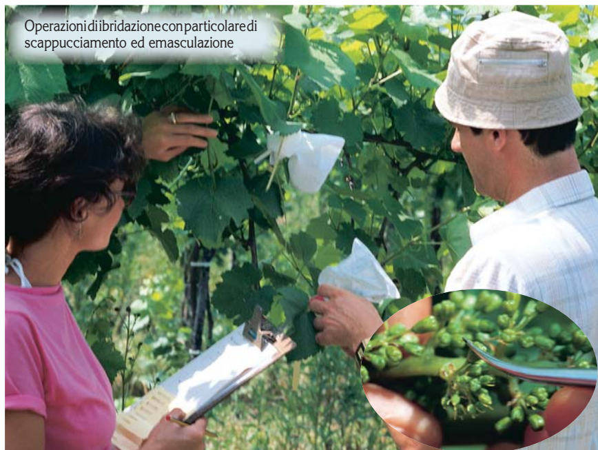
Operazioni di ibridazione con particolare di scappucciamento ed emasculazione

Con l'incrocio (unione di due vitigni, un padre ed una madre, appartenenti alla stessa specie, in genere la V. vinifera ) si ottengono nuove varietà che rispondono alle esigenze riportate nell'introduzione di questo articolo. Il loro successo commerciale è tangibile per le uve da tavola (es. Italia, Victoria, Matilde, Red Globe, ecc.), più problematico per le uve da vino, almeno finora, ma in futuro potremo avere delle piacevoli sorprese. In tab. 1 sono riportati alcuni incroci da vino, di un certo interesse, ottenuti in Italia. Tra questi vorrei enfatizzare l'ERVI (Barbera x Croatina), molto interessante da un punto di vista viticolo per la sua vigoria contenuta, la buona tolleranza alla bo-