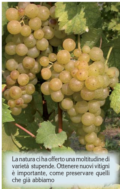
La natura ci ha offerto una moltitudine di varietà stupende. Ottenere nuovi vitigni è importante, come preservare quelli che già abbiamo

Anche in questo caso il metodo di ottenimento è l'ibridazione, che ha dato risultati molto concreti, visto che la quasi totalità della viticoltura mondiale utilizza il portinnesto, che permette alla pianta di resistere ai danni da fillossera, di adattarsi ai terreni e di regolare la vigoria.