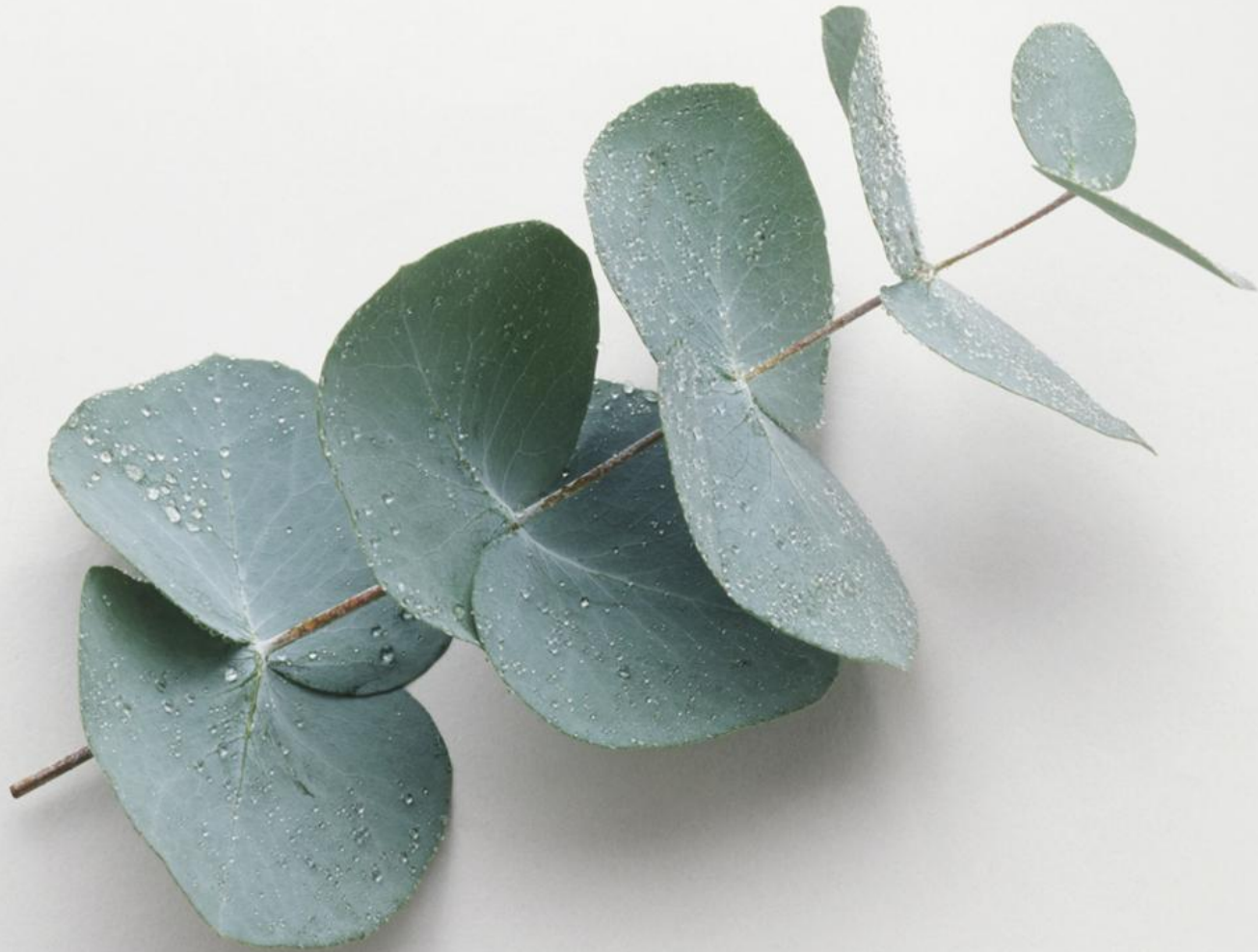
Foglie giovanili di Eucalyptus