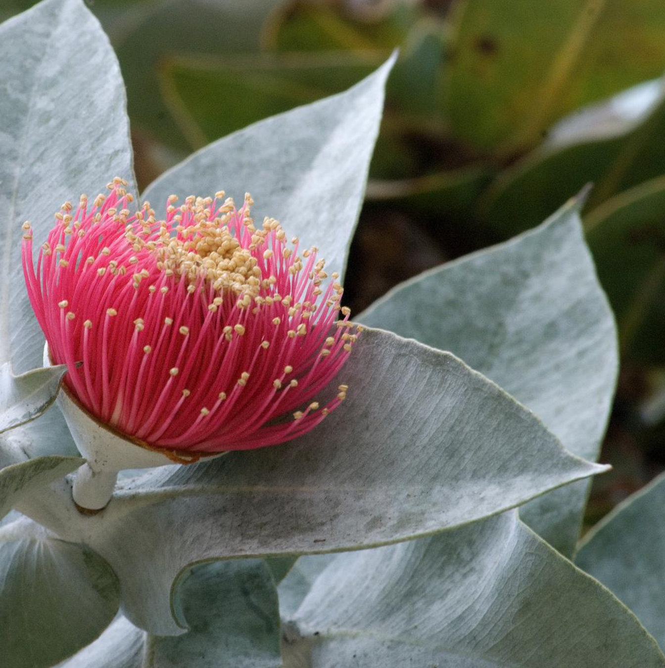
Fiore di Eucalyptus macrocarpa