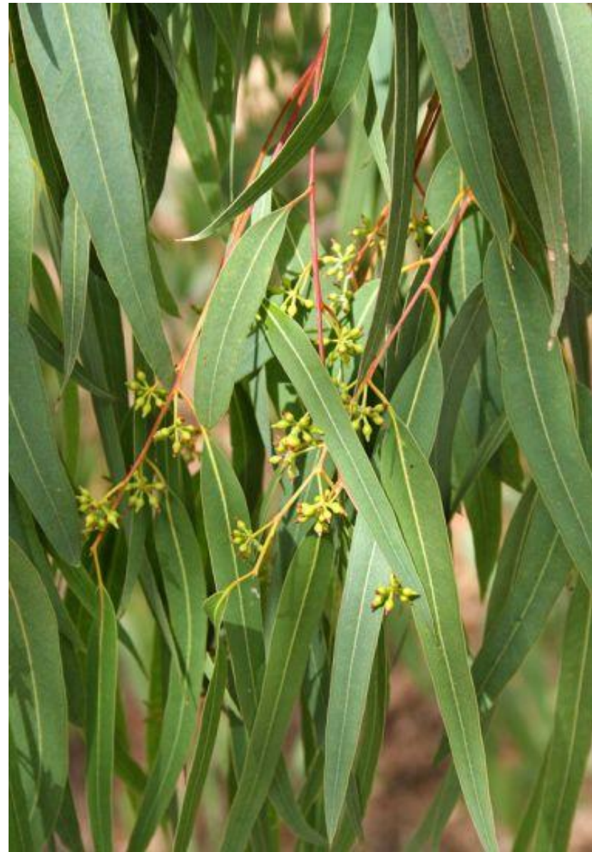
Foglie di un esemplare adulto