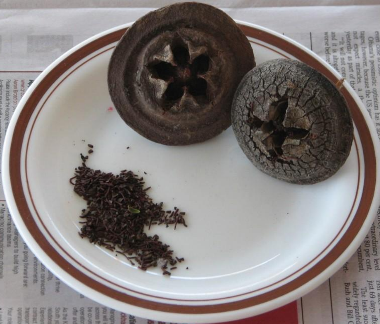
Frutti (capsule) e semi di Eucalyptus