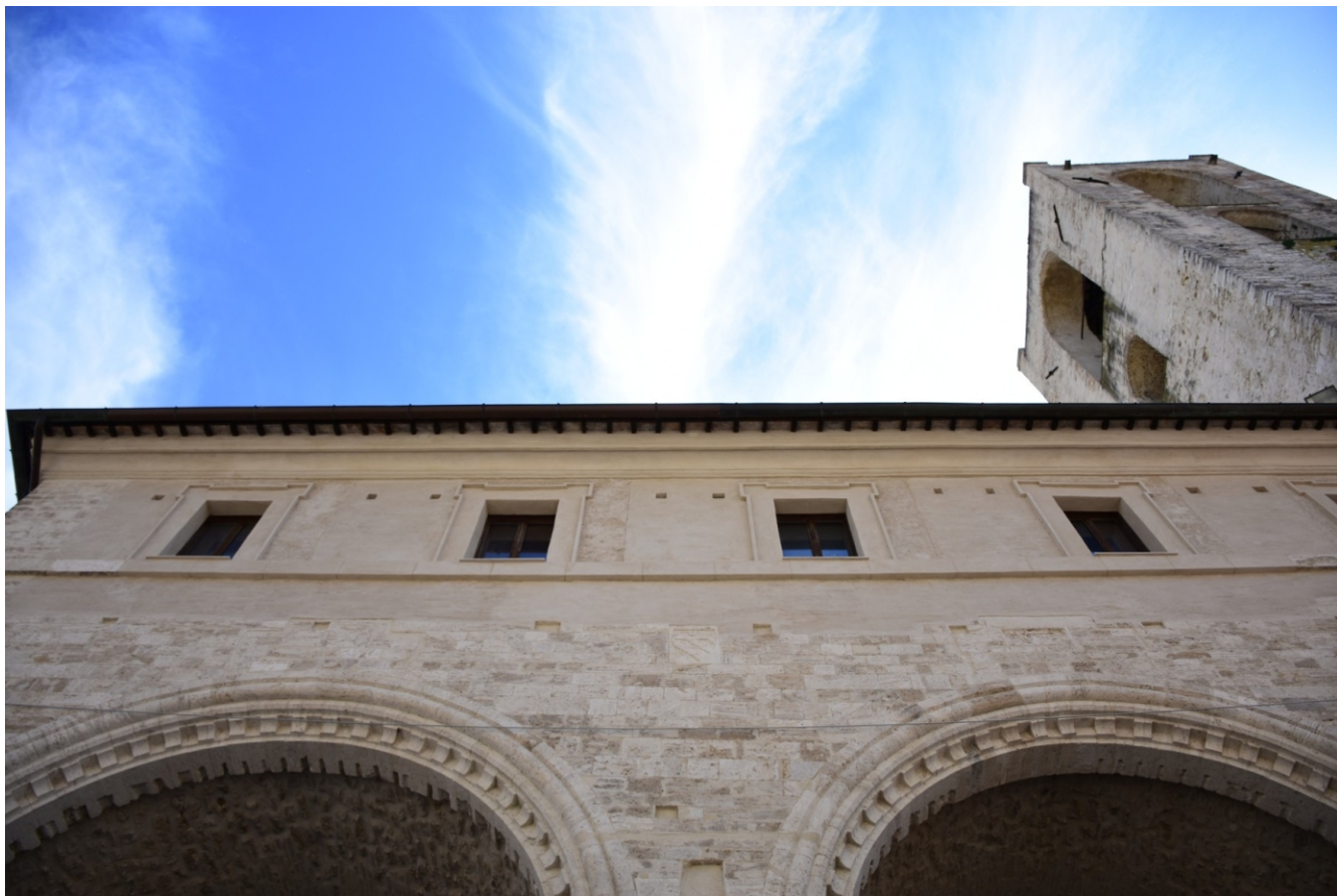
Città di NARNI - Particolare Palazzo dei Priori