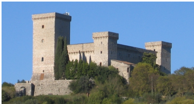
La Rocca, Lucrezia Borgia, i fantasmi