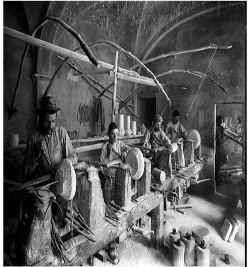
N.° 51688. VOLTERRA - Laboratorio di Anagni.

- Tradizioni artigianali e commerciali , non erose dalla industrializzazione, da queste sono venute le risorse di imprenditorialità