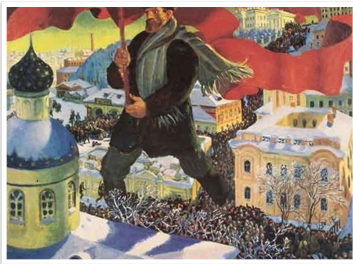
Boris Kustodiev, Il bolscevico (1920)