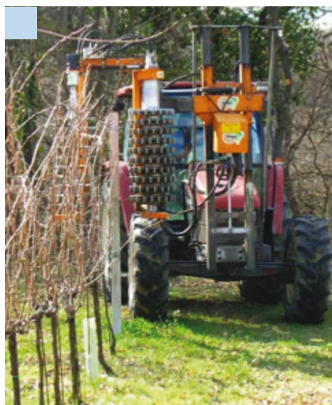
1 - Filari di Sangiovese allevati a cordone speronato con pre-potatrice a dischi orizzontali al lavoro (sopra) e subito dopo la pre-potatura meccanica (sotto).

Pertanto, in annate caratterizzate da periodi primaverili ed estivi particolarmente freschi e piovosi, quali 2002, 2005, 2006, 2010 e 2014, l'attenzione deve essere rivolta prevalentemente alla pressione dei patogeni, al