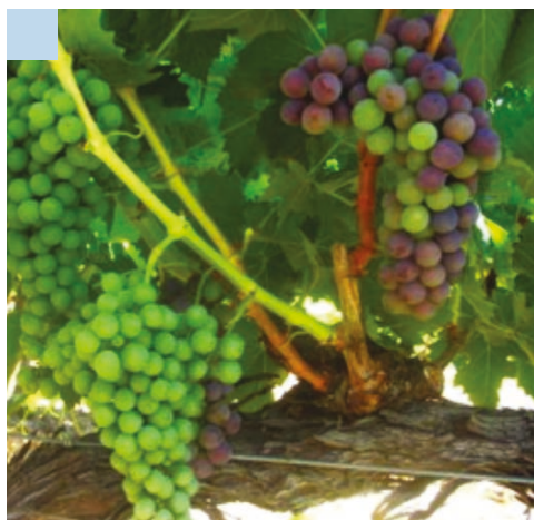
3 - Grappoli con differente stadio di maturazione portati da germogli derivanti da gemme che in fase di rifinitura erano già germogliate (grappoli normali) o erano ancora in quiescenza e si sono aperte dopo la rifinitura manuale (grappoli ritardati). Foto del 3 agosto 2015 (sopra) e del 21 agosto 2015 (sotto).