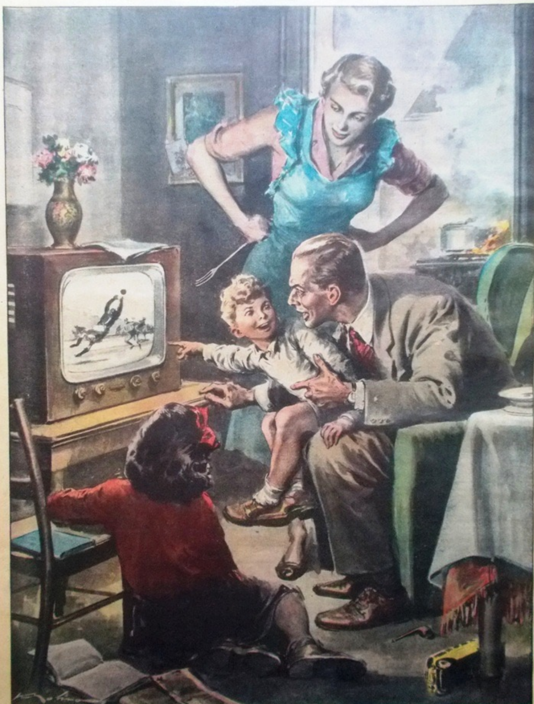
Rivoluzione in famiglia: l'arrosto brucia, i bambini dimenticano i compiti, il papà la pipa e l'appuntamento al caffè. Dopo due anni di fase sperimentale, cominciano in Italia le trasmissioni regolari della televisione da Milano, Torino e Roma con un programma per ora unico. (Dis. di Walter Molino)

ANNO 36 - N. 1 LA DOMENICA DEL CORRIERE 1 GENNAIO 1954 - L. 36 LA COPPIA