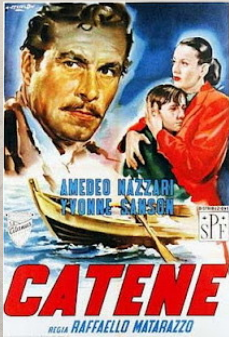
Catene, Raffaello Matarazzo, 1949

Il melodramma è un genere di enorme successo negli anni Cinquanta, anche per il suo legame con altri prodotti della cultura popolare come il fotoromanzo e il romanzo d'appendice. In più si lega direttamente ai film «strappalacrime» di ambientazione napoletana degli anni Venti, dei quali in molti casi le pellicole melodrammatiche sono un esplicito rifacimento