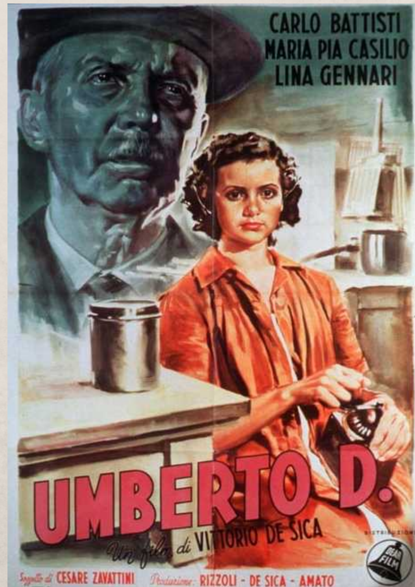
Umberto D. , Vittorio De Sica, 1952

Con la legge Andreotti del 1949, lo Stato finanzia il cinema con un sistema che sembra premiare soprattutto i film di grande successo al botteghino. È un segnale di freddezza nei confronti del neorealismo. Nel 1952, in occasione dell'uscita di Umberto D. il sottosegretario Andreotti polemizza duramente con Vittorio De Sica.