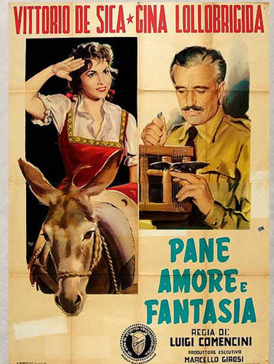
Pane, amore e fantasia , Luigi Comencini, 1953

...se è vero che il male si può combattere anche mettendone duramente a nudo gli aspetti più crudi, è pur vero che se nel mondo di sarà indotti – erroneamente – a ritenere che quella di Umberto D. è l'Italia della metà del secolo Ventesimo, De Sica avrà reso un pessimo servizio alla sua patria