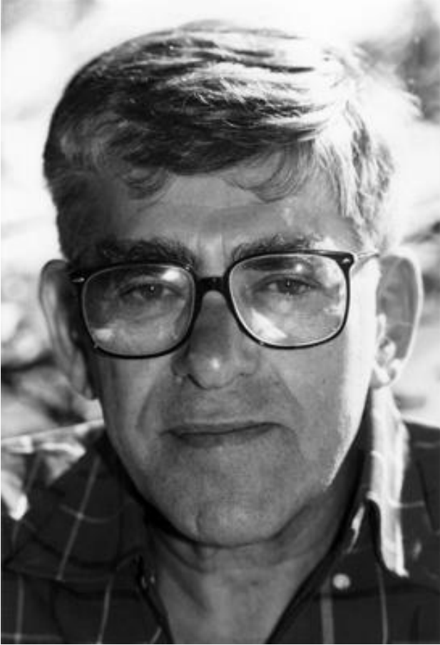
Philip Selznick (1919 -2010)