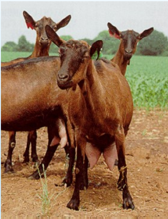
CAMOSCIATA DELLE ALPI