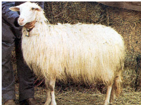
from Lane d'Italia