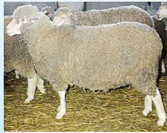
provided by Francesco Panella