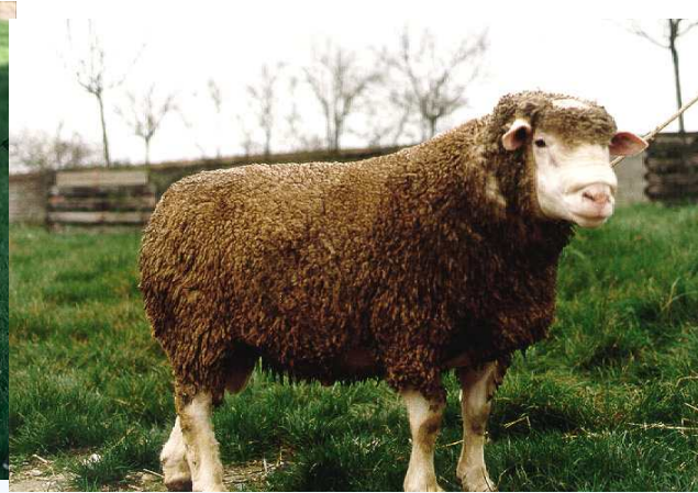
ILE DE FRANCE