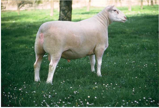
BERICHON DU CHER