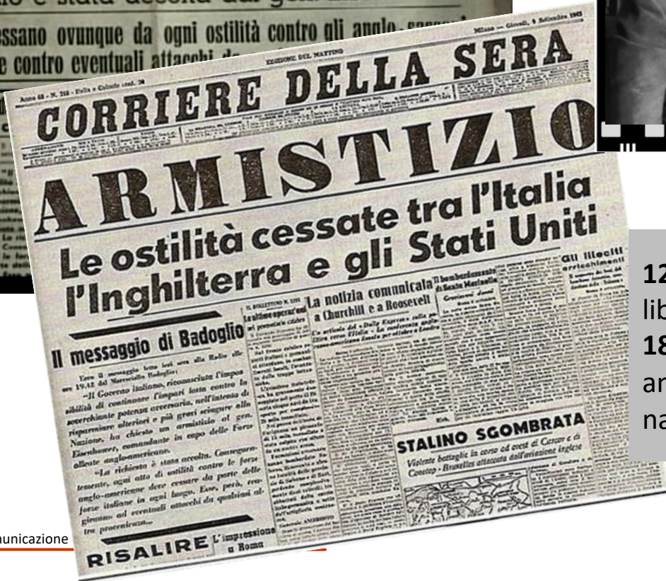
Tutti a casa (Luigi Comencini, 1960)