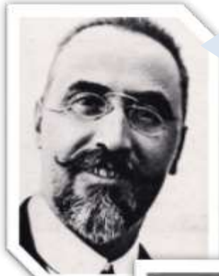
Ivanoe Bonomi, Democrazia del lavoro

Tutti i cittadini hanno diritto di associarsi liberamente in partiti per concorrere con metodo democratico a determinare la politica nazionale [Costituzione italiana, art. 49]