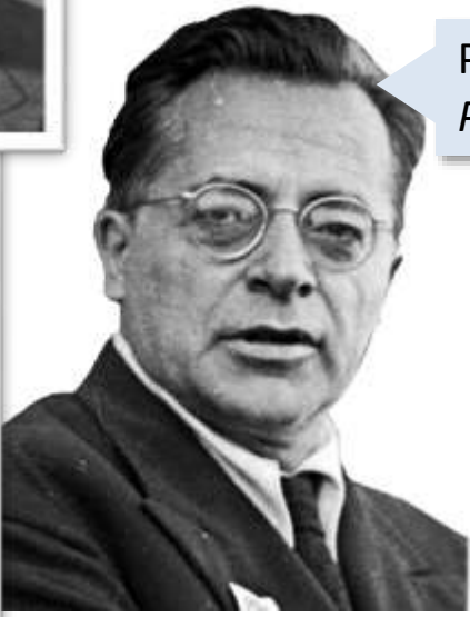
Palmiro Togliatti, Partito Comunista Italiano