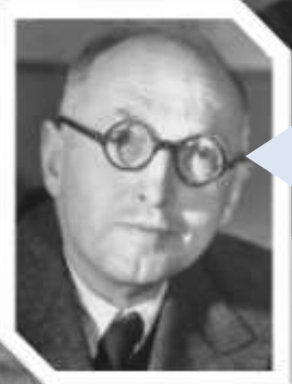
Pietro Nenni, Partito Socialista Italiano