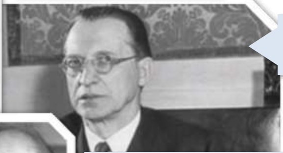
Alcide De Gasperi, Democrazia Cristiana