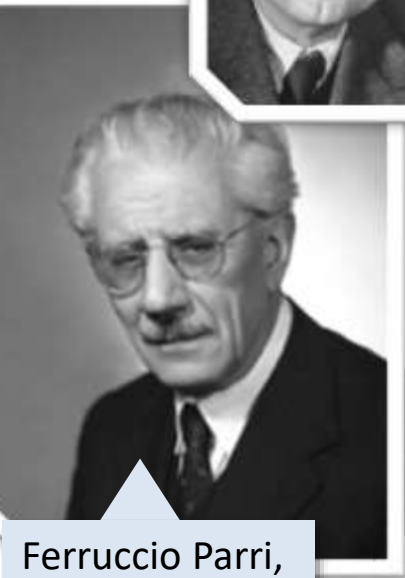
Ferruccio Parri, Partito d'Azione