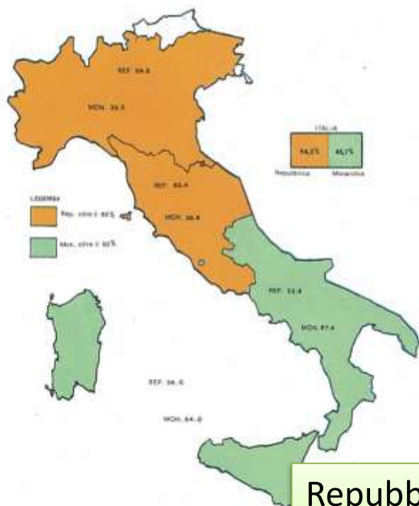
Fig. 4 - REFERENDUM ISTITUZIONALE AREE GEOGRAFICHE A MAGGIORANZA MONARCHICA O REPUBBLICANA

Repubblica: 54,3% (12.700.000) Monarchia: 45,7% (10.700.000)