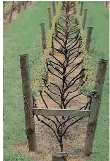
Foto 4 - Lyra, da D.Jackson, pruning and trellising, Daphne Brasell and Associates