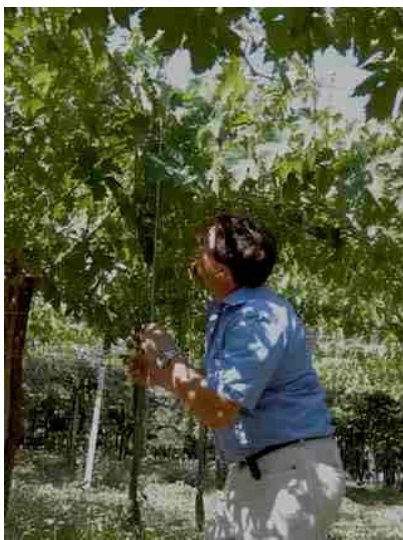
Foto 1 - misure di 'point quadrat' su vigneto a tendone, Cantina Colle Moro(CH)

Se noi sottoponiamo a questo test i vigneti italiani, osserviamo un eccesso di vigore quasi generalizzato, rispetto ai parametri considerati ideali, e quindi punteggi bassi. Si "salvano" quasi esclusivamente vigneti di collina, impiantati su terreni poveri, non più giovani, e finalizzati a produzioni di particolare pregio: il che, in un certo senso, conferma la validità del metodo. Questo vuol dire che in tutti gli altri vigneti non si fa qualità? Quando l'eccesso di vigore è molto forte, non ci sono dubbi, è proprio così. Il troppo vigore rallenta la maturazione, perché gli apici continuano a vegetare anche a fine estate ed entrano in competizione con i grappoli per l'approvvigionamento degli zuccheri e degli altri elaborati; inoltre si crea un microclima umido e ombreggiato all'interno della chioma, che favorisce le crittogame, e la permanenza nell'uva di forti quantità di acido malico e di sostanze di odore e sapore erbaceo o precursori di tali sensazioni che poi si ritrovano nei vini, tal quali o come metaboliti: ne derivano "spremute di prateria", secondo una colorita definizione di Fregoni.