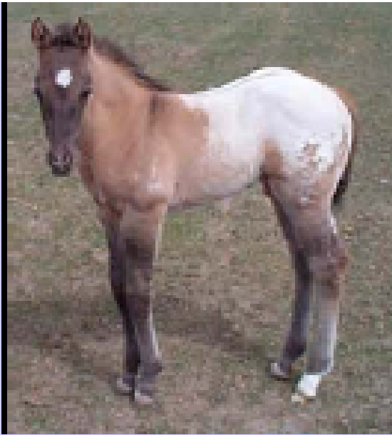
Appaloosa baio sella uniforme