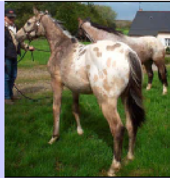
Appaloosa baio sella maculata