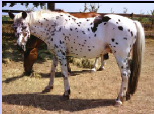
Appaloosa baio leopardato