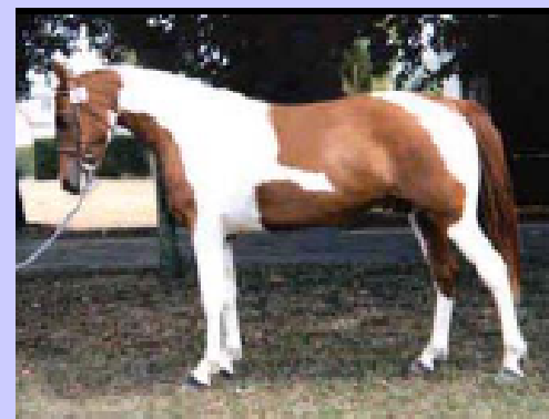
sauro pezzato tobiano