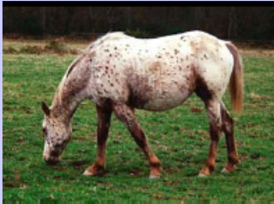
Appaloosa sauro maculato