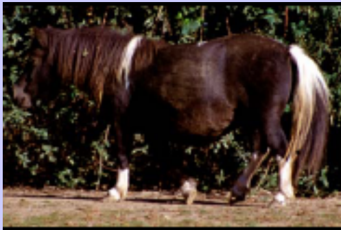
Nero pezzato tobiano