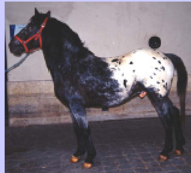
Appaloosa baio scuro sella maculata