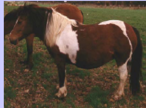
baio pezzato tobiano