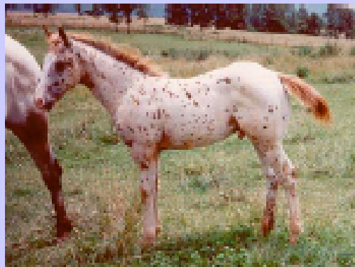
Appaloosa sauro leopardato