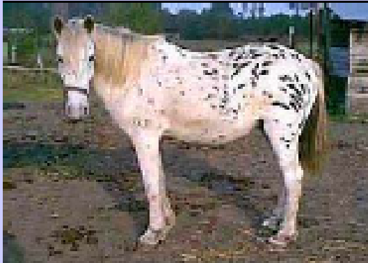
Appaloosa nero leopardato