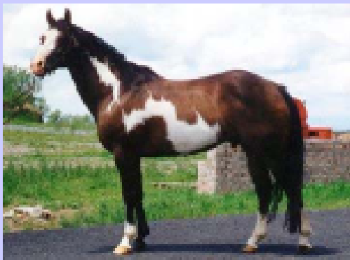
baio pezzato overo