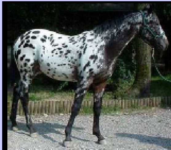
Appaloosa baio scuro maculato