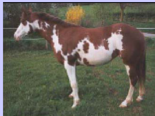
sauro scuro pezzato overo