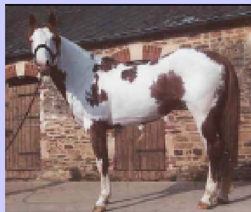
sauro pezzato overo