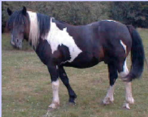
Nero maltinto pezzato tobiano