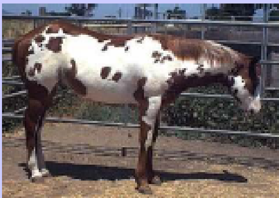
Sauro bruciato pezzato overo