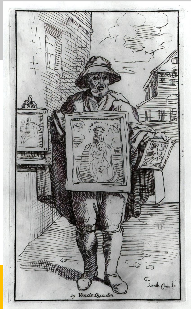
Annibale Carracci, venditore di quadri (incisione)

Le relazioni tra artisti e committenti erano cruciali per assicurarsi importanti commissioni. Gli artisti sviluppavano strategie per costruire e mantenere queste relazioni, utilizzando la loro reputazione, abilità negoziali e qualità delle opere come strumenti di persuasione. Queste relazioni influenzavano direttamente il successo e la sostenibilità della loro carriera.