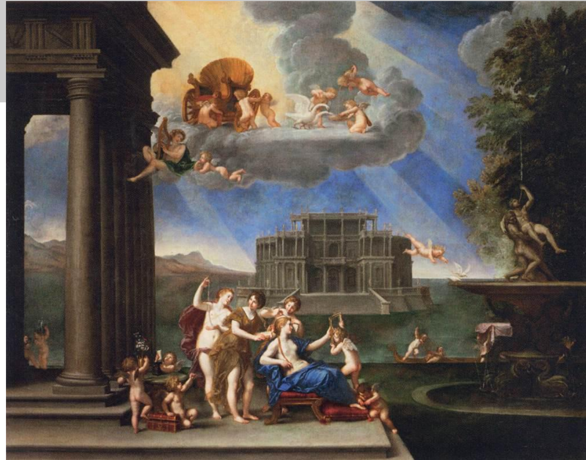
Francesco Albani, la toletta di Venere, 1622-1630, Parigi, Louvre (insieme a: Adone condotto da amorini a Venere, Amorini disarmati, Riposo di Venere e Vulcano)

IL COSTO DELLA VITA E LE STRATEGIE DI PREZZO DEGLI ARTISTI