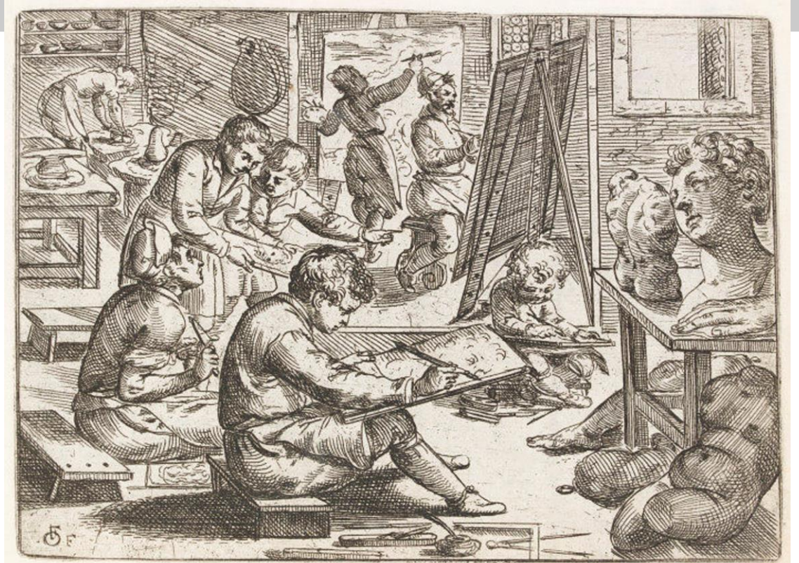
Odoardo Fialetti, frontespizio de Il vero modo et ordine per dissegñar tutte le parti et membra del corpo humano

I costi delle operazioni preliminari e della manodopera erano spesso a carico del committente, influenzando il prezzo finale delle opere d'arte. La gestione economica degli atelier richiedeva una precisa organizzazione delle risorse e delle strutture necessarie per la produzione artistica. Gli atelier non erano solo luoghi di creazione artistica, ma anche centri di attività economica e logistica.