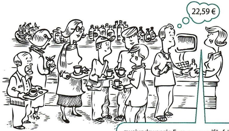
zweiundzwanzig Euro neunundfünfzig