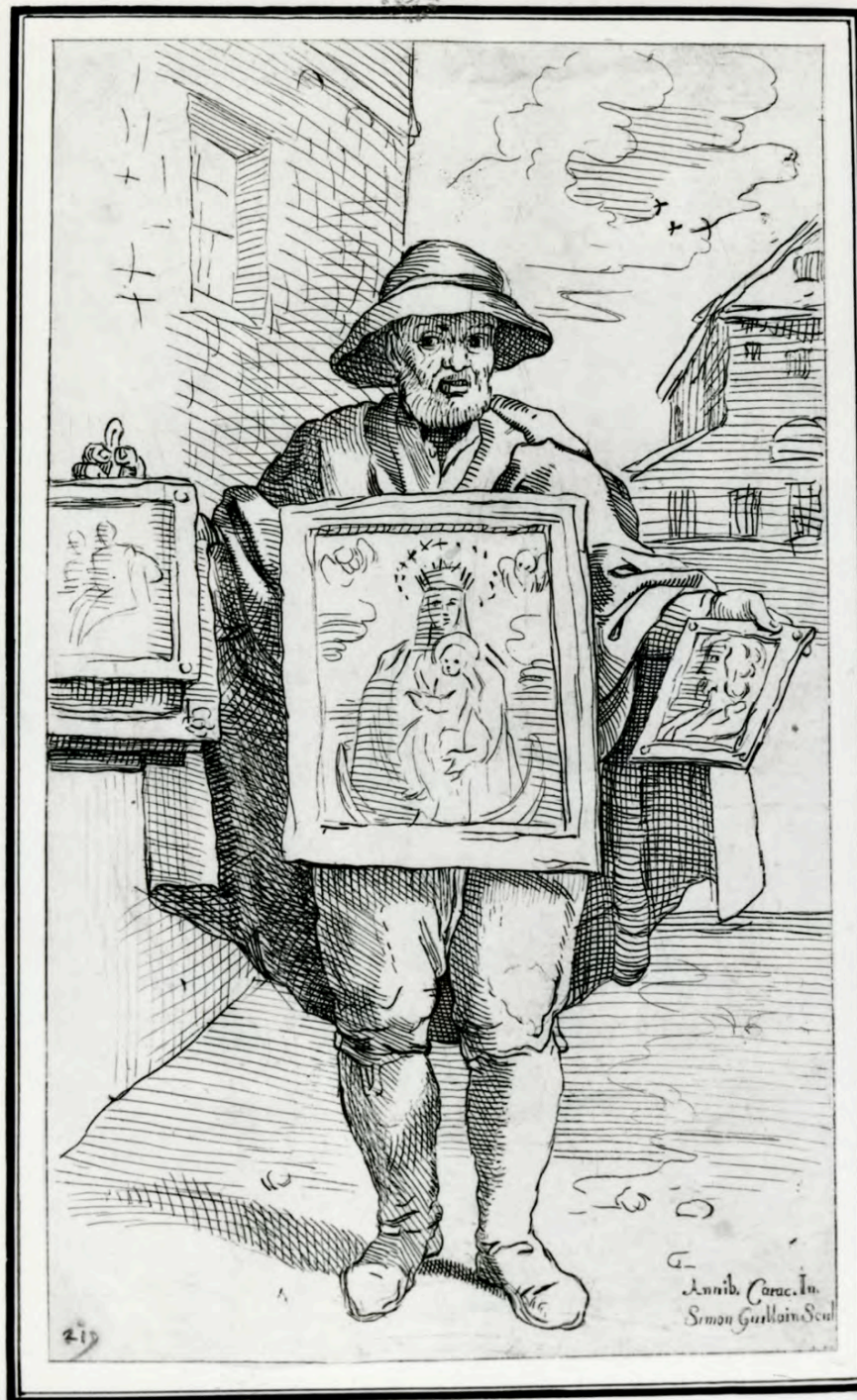
Incisione di Simon Guillain da Annibale Carracci, Venditore di quadri, 1600