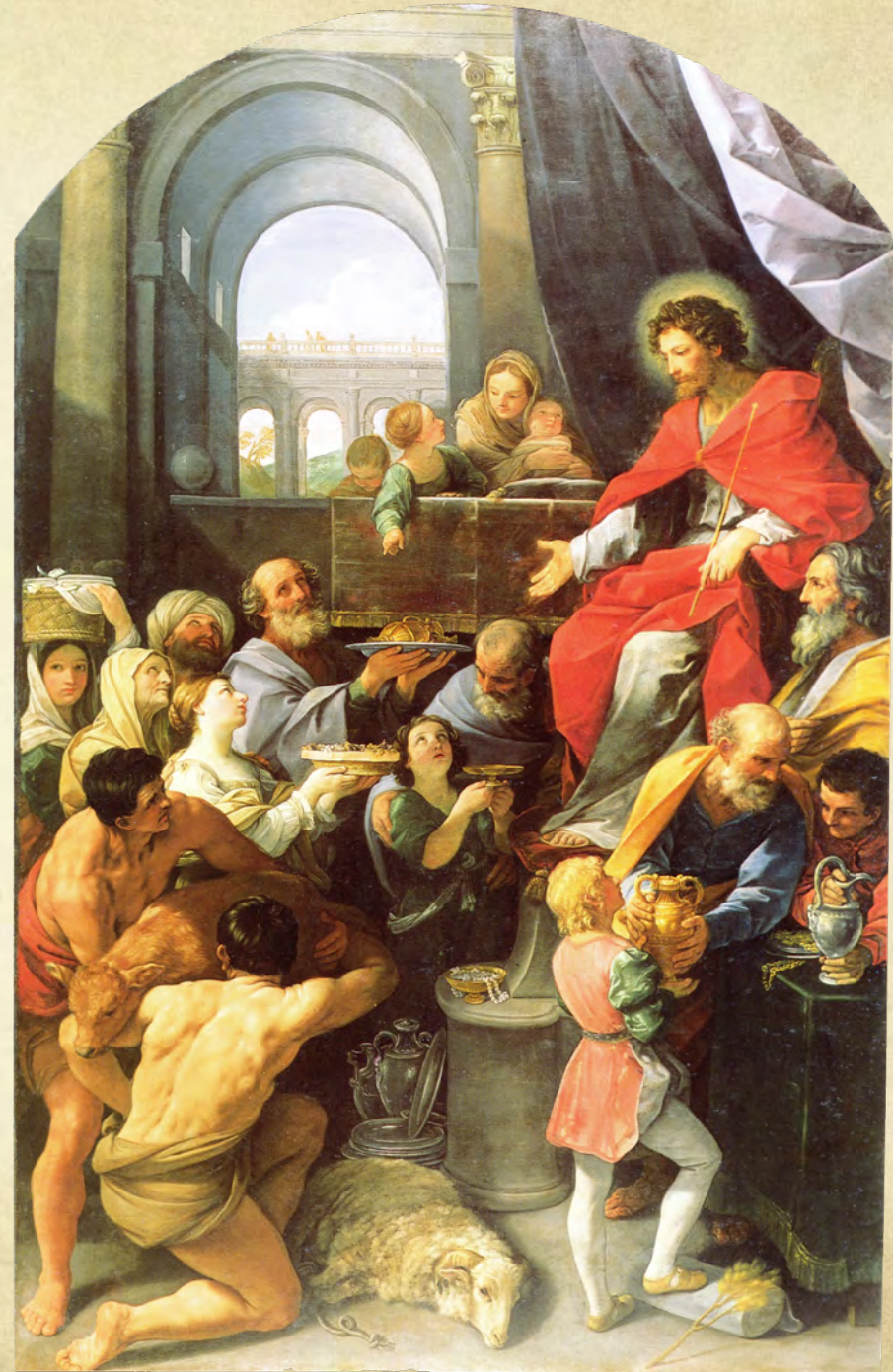
G. Reni, Il trionfo di Giobbe , 415x256 cm, Parigi, Notre Dame.