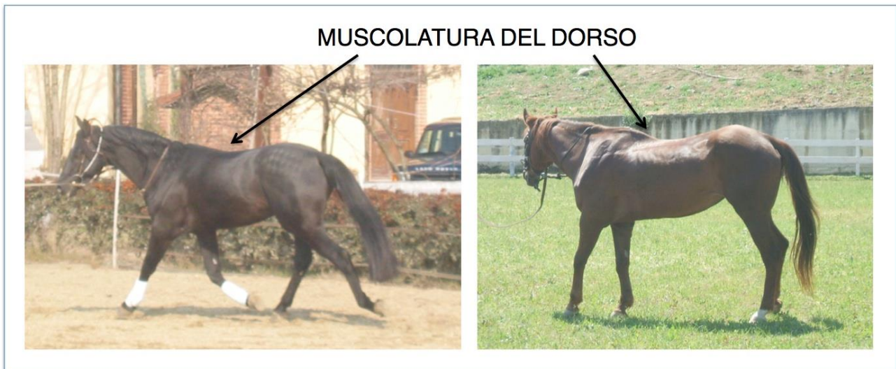
Figura 2. A sinistra: cavallo allenato attraverso un lavoro quotidiano alla corda secondo il metodo della Società Italiana di Arte Equestre Classica. A destra: un caso di ipotrofia del muscolo lungo dorsale in un cavallo utilizzato dagli allievi di una scuola di equitazione.

Quanto detto tuttavia non è ancora sufficiente: poiché l'equitazione rappresenta l'unico sport in cui due esseri viventi compiono movimenti in sincronia e mutuo contatto, e poiché l'uomo esercita con il suo assetto una profonda influenza sul comportamento del cavallo (tensione di redini, contatto delle gambe sui fianchi, uso del proprio peso e dell'assetto), il secondo componente del binomio diventa fondamentale per il benessere del cavallo. Il peso del cavaliere induce già di per sé un'estensione della colonna che contribuisce a causare lesioni ai tessuti molli e la "kissing-spine" syndrome (De Cocq et al., 2004); il sovraccarico della regione lombare o un'eccessiva tensione delle redini causano invece "mal di schiena" (Heuschmann, 2006; von Borstel et al., 2009).