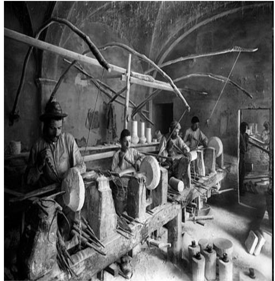
N° 31488. VOLTERRA - Laboratorio di Albano.

- Tradizioni artigianali e commerciali, non erose dalla industrializzazione, da queste sono venute le risorse di imprenditorialità